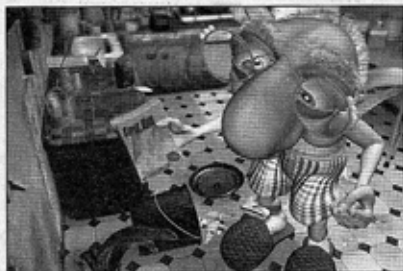
Wilson, en su pequeño apartamento de renta antigua.