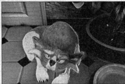
Freddy, una de las mascotas de Las gafas equivocadas.